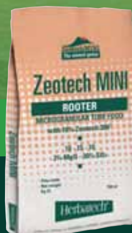
ZEOTECH MINI ROOTER nuove semine e rinnovamenti

Garantisce una distribuzione omogenea ed un rapido scioglimento ed assimilazione. Irrobustisce il green, migliorandone la qualità e riducendo l'effetto grain. Aiuta a combattere le malattie e produce una eccellente colorazione verde brillante che sostituisce eccessive concimazioni azotate.