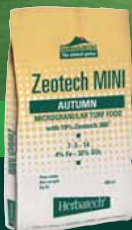
ZEOTECH MINI AUTUMN stress control estate-inverno